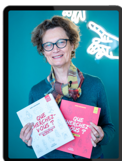
"Que cherchez-vous ?" (2023), est un grand succès.

Préparez-vous à jouer, à réfléchir et à grandir avec Playspi !