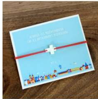
Bracelet croix en nacre PAR LOT DE 30 - JM334 6€ TTC - Tarif association 1,98€ TTC