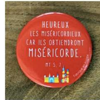
Aimant miséricorde rouge PAR LOT DE 100 - JM22 3€ TTC - Tarif association 1,32€ TTC