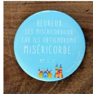
Aimant miséricorde bleu PAR LOT DE 100 - JM19 3€ TTC - Tarif association 1,32€ TTC