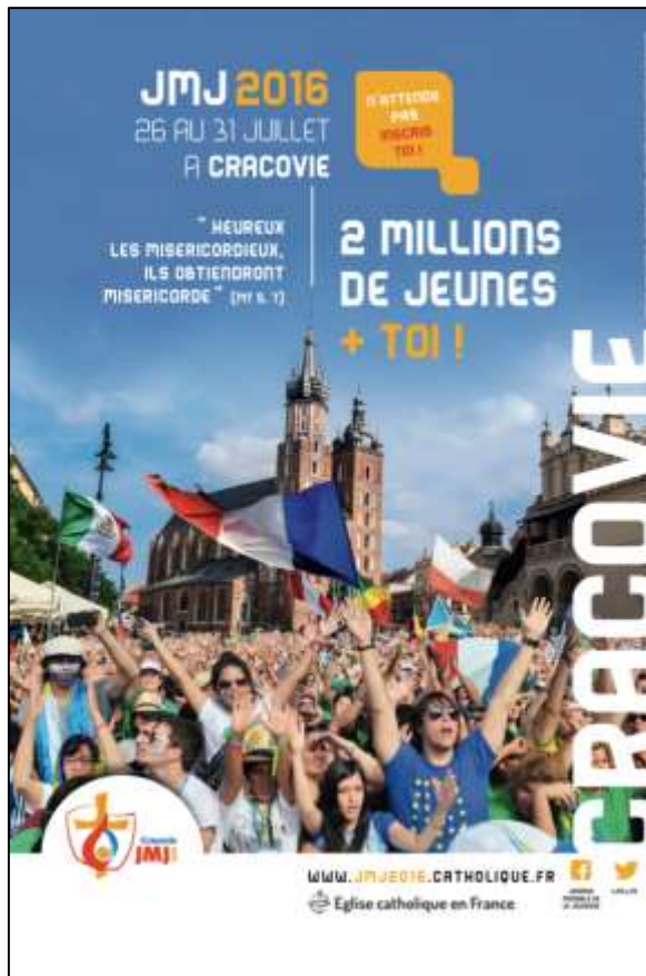
L'affiche officielle, personnalisable