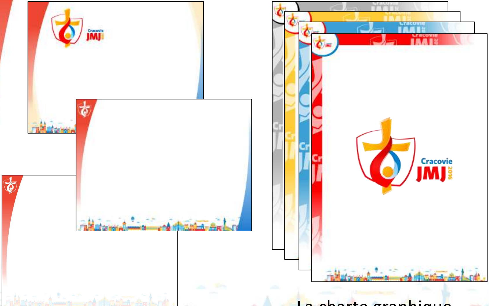
La charte graphique