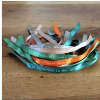
Bracelet ruban Evangile (FR) PAR LOT DE 500 - GDM331 1€ TTC - Tarif association 0,30€ TTC

DES PRODUITS POUR FINANCER VOTRE VOYAGE À CRACOVIE