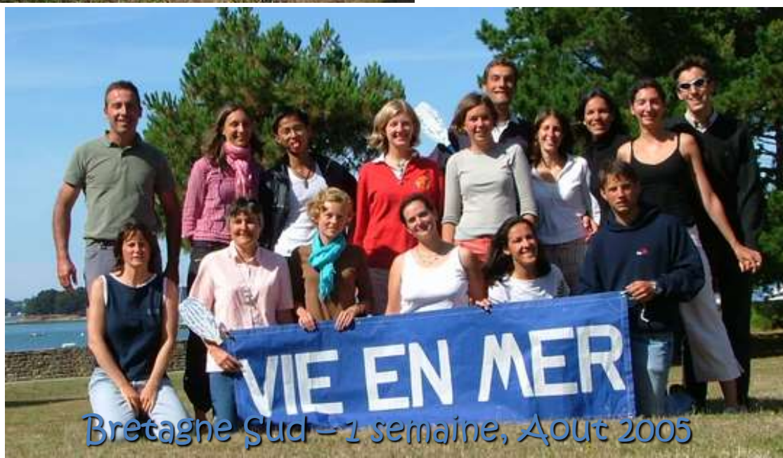
Bretagne Sud - 1 semaine, Août 2005