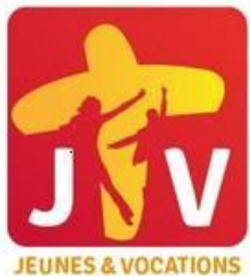
Plate-forme Ecclésiale pour le Service Civique Novembre 2016