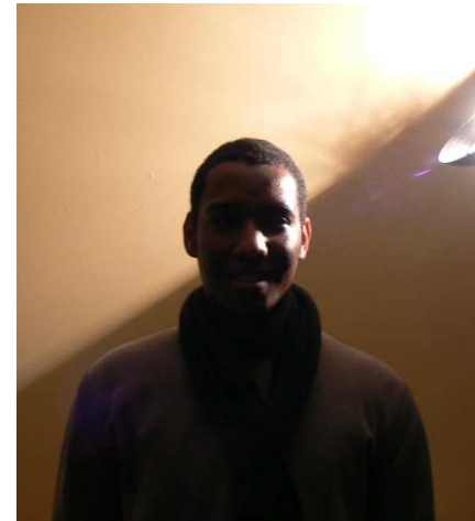
Loudvik, L2 AEI