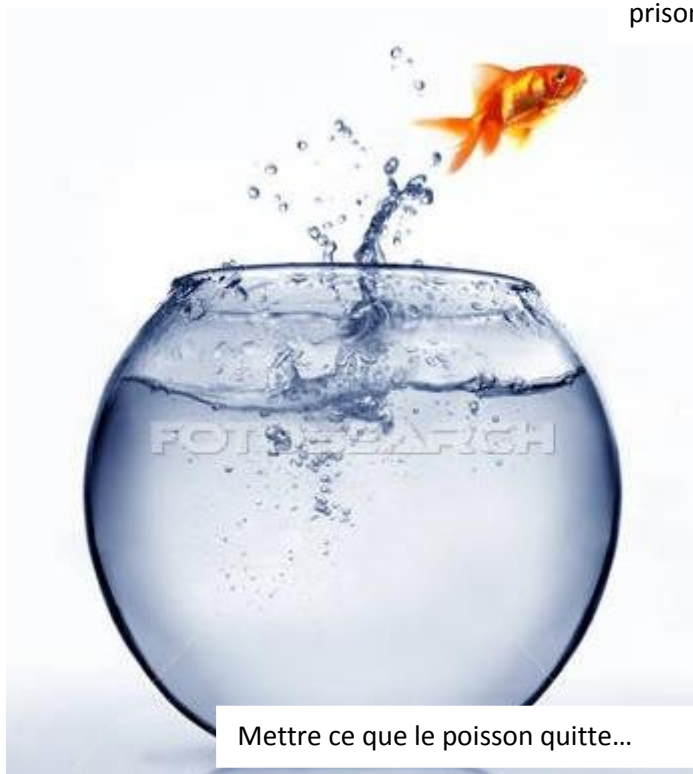
Photo de prison